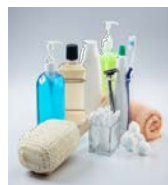
11. Προσωπικής περιποίησης/ υγιεινής