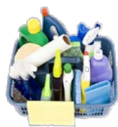
7. Οικιακού καθαρισμού/ περιποίησης