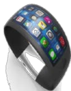
1. Υψηλής τεχνολογίας