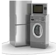
3. Ηλεκτρικών ειδών