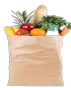
8. Τροφίμων & ποτών