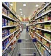
2. Super markets