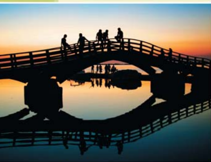
Στέλλα Διδυμιώτη>Mellon Collection Services Γέφυρα στην είσοδο της πόλης Λευκάδα 2007

Ο Όμιλος Εταιρειών Mellon διοργάνωσε τον Δεκέμβριο του 2007 διαγωνισμό φωτογραφίας στον οποίο συμμετείχαν εργαζόμενοι από όλες τις εταιρείες του Ομίλου. Οι φωτογραφίες αυτές κοσμούν σήμερα τον κοινωνικό μας απολογισμό για το έτος 2007. Σας ευχαριστούμε.